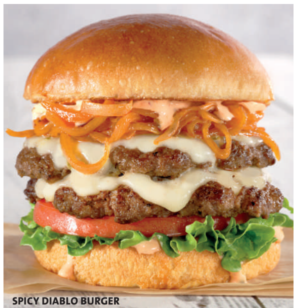
SPICY DIABLO BURGER