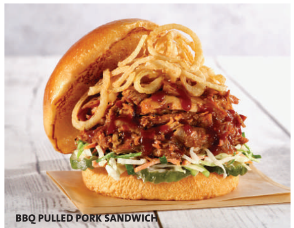
BBQ PULLED PORK SANDWICH

Hand-pulled smoked pork with our house-made barbecue sauce, served on a fresh toasted bun with coleslaw, pickles and shoestring onions. 細かく裂いたポークにBBQソースで味付けしたサンドイッチ。