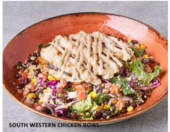
SOUTH WESTERN CHICKEN BOWL

新鮮なグリーン野菜をワカモレランチドレッシングで和え、スパイシーに焼き上げたチキン、赤キャベツ、ピコデガロ、キヌアコンサラダ、ブラックビーンズミックスをトッピング。