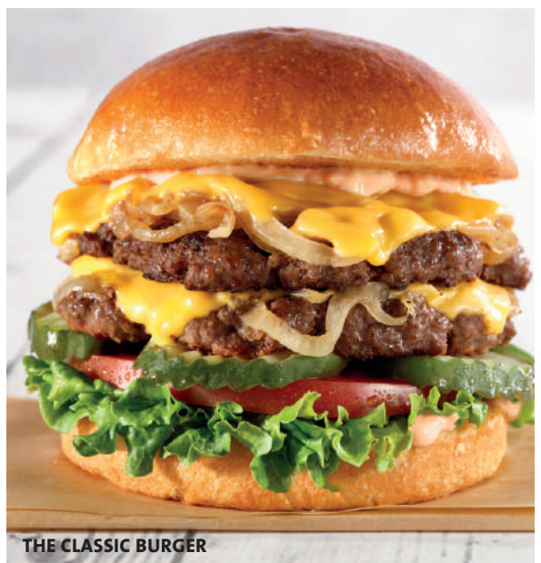
THE CLASSIC BURGER