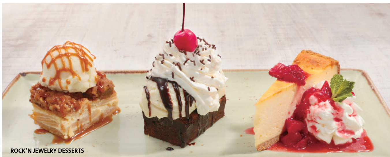
ROCK'N' JEWELRY DESSERTS

Prices include tax. 10% service charge will be added.