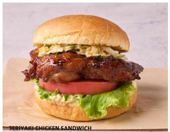
TERIYAKI CHICKEN SANDWICH

Crispy buttermilk-marinated chicken breast with leaf lettuce, vine-ripened tomato and ranch dressing, served on a toasted bun. クリスピーフライドチキン、トマト、リーフレタス、ランチドレッシング。