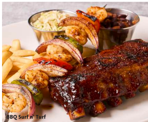
BBQ Surf n' Turf

BBQ RIBS & PULLED PORK BBQ リブ&プルドポーク ¥4,380-