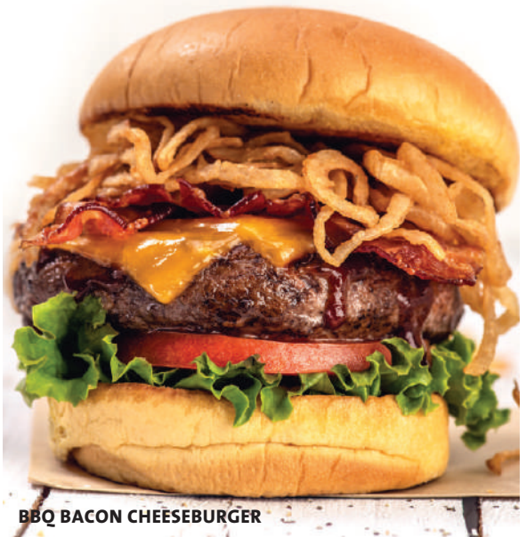
BBQ BACON CHEESEBURGER

A hand-made black bean, corn and quinoa veggie burger topped with grilled pineapple, barbeque sauce, Monterey Jack cheese, crispy shoestring onion, served on a toasted bun with a spicy slaw.† ブラックビーン、キヌア、コーンパテ、モンテレージャックチーズ、BBQパイナップル、コールスロー、フライドオニオン