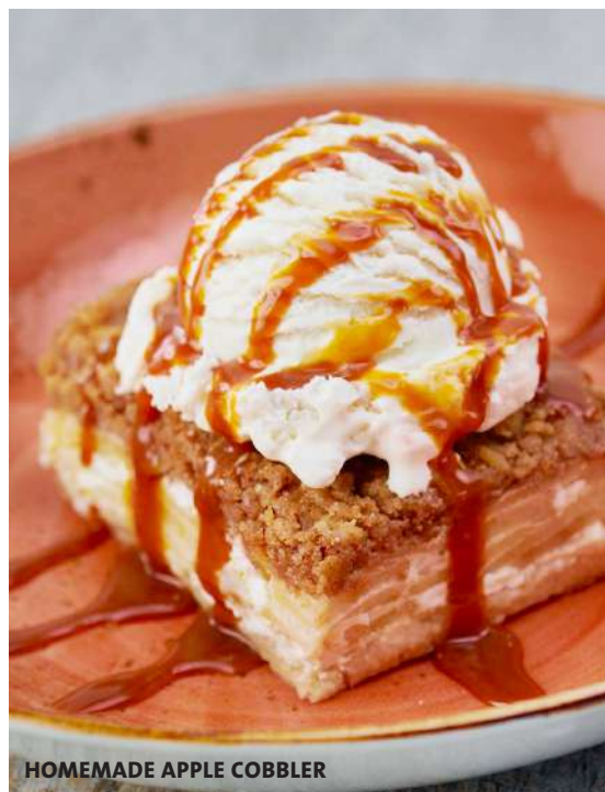
HOMEMADE APPLE COBBLER

ブラウニー、アップルコブラー、チーズケーキの三種類を一度に楽しめる贅沢で欲張りでロックな一皿です。