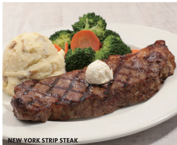
NEW YORK STRIP STEAK