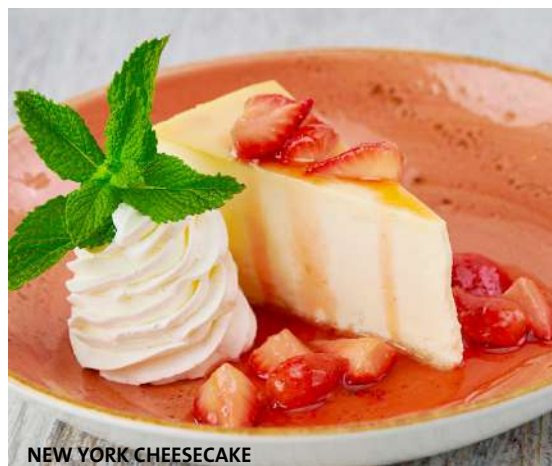
NEW YORK CHEESECAKE

クリーミーで豊かな味わいのニューヨークスタイルチーズケーキにストロベリーソースをトッピング。ホイップクリーム添え。