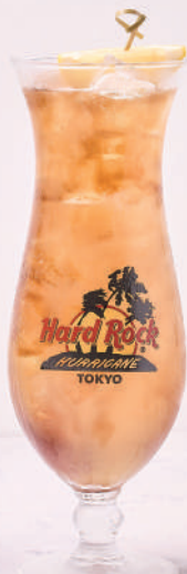
ULTIMATE LONG ISLAND ICED TEA