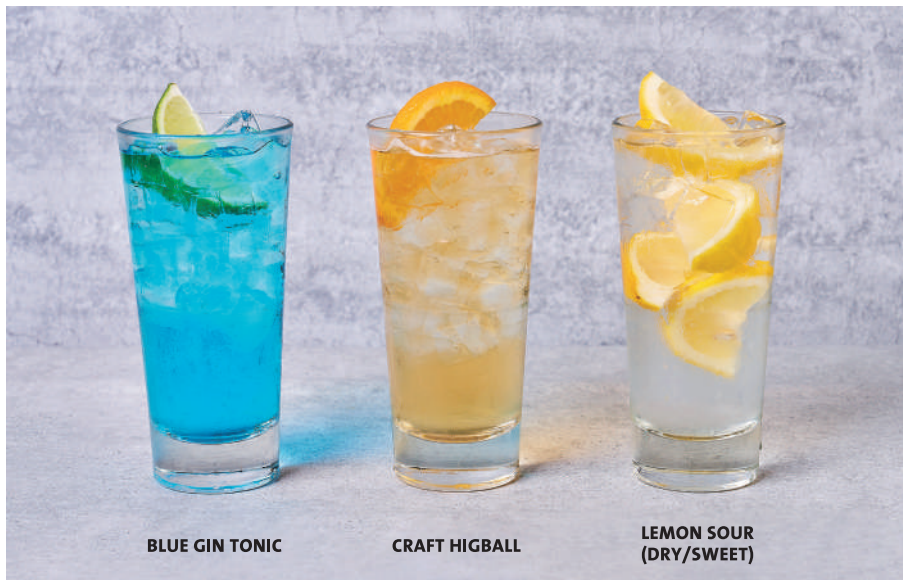
BLUE GIN TONIC

熊本県産のクラフトジン"八つ星"をフィーバーツリートニックウォーターで仕上げたプレミアカクテル。