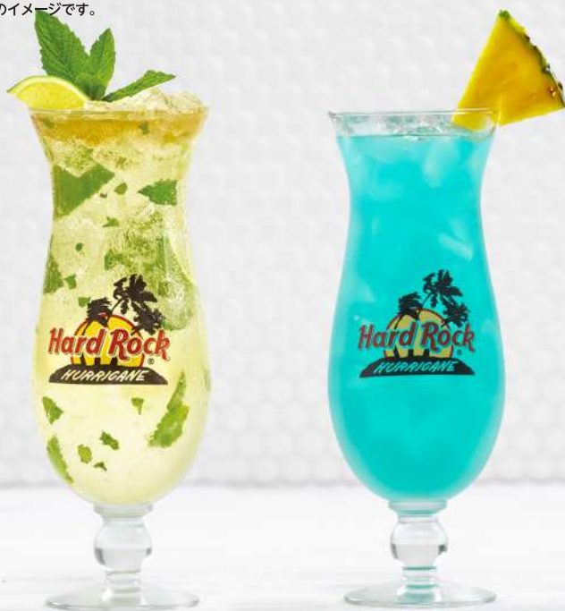
CLASSIC CARIBBEAN MOJITO

Product image is a cocktail with the collectible glass. グラス付きカクテルのイメージです。