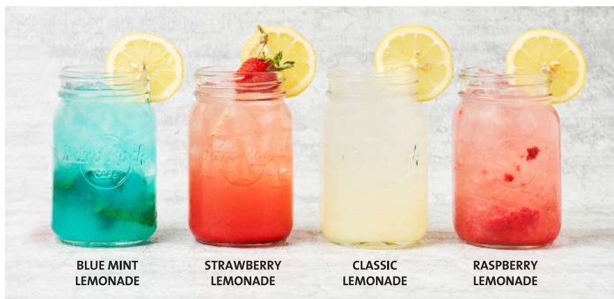
BLUE MINT LEMONADE