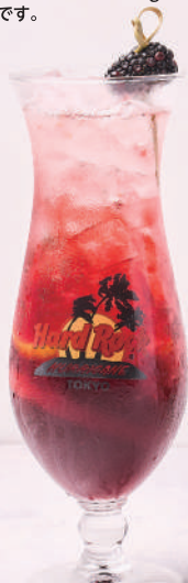
BLACKBERRY SPARKLING SANGRIA

Product image is a cocktail with the collectible glass. グラス付きカクテルのイメージです。