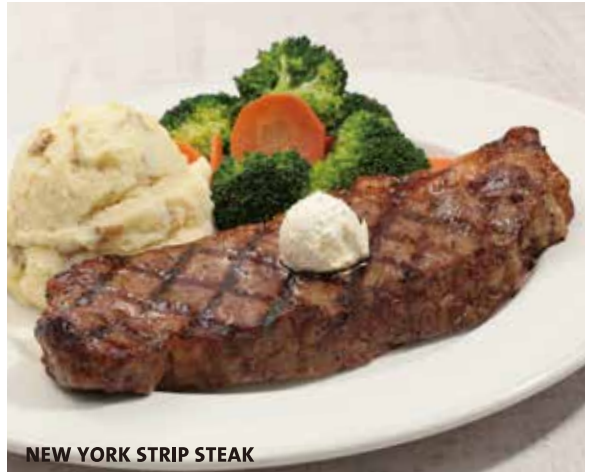
NEW YORK STRIP STEAK