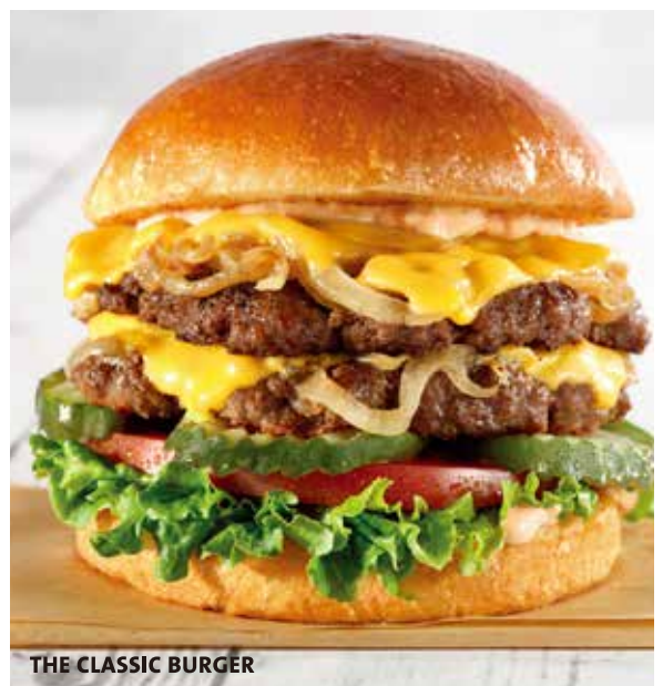
THE CLASSIC BURGER