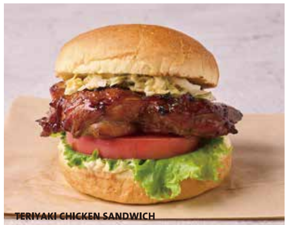
TERIYAKI CHICKEN SANDWICH

Crispy buttermilk-marinated chicken breast with leaf lettuce, vine-ripened tomato and ranch dressing, served on a toasted bun. クリスピーフライドチキン、トマト、リーフレタス、ランチドレッシング。