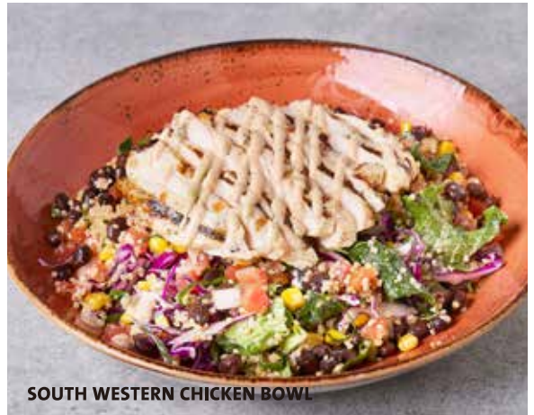
SOUTH WESTERN CHICKEN BOWL

新鮮なグリーン野菜をワカモレランチドレッシングで和え、スパイシーに焼き上げたチキン、赤キャベツ、ピコデガロ、キヌアコンサラダ、ブラックビーンズミックスをトッピング。