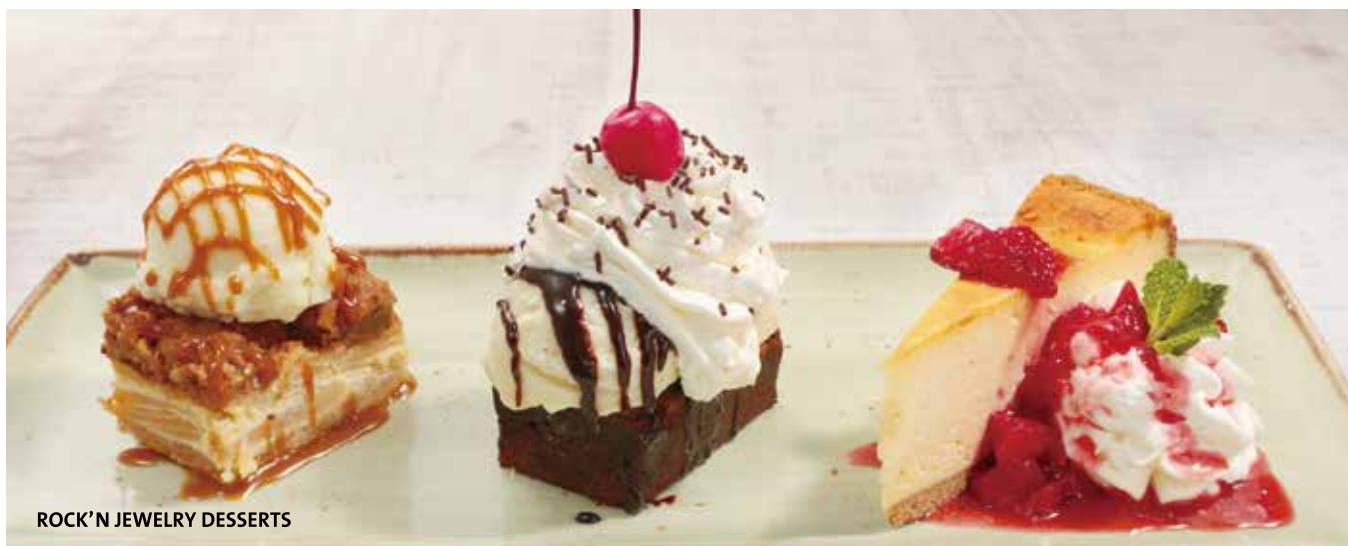
ROCK 'N' JEWELRY DESSERTS

Prices include tax. 10% service charge will be added.