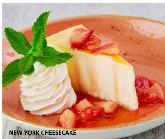
NEW YORK CHEESECAKE

クリーミーで豊かな味わいのニューヨークスタイルチーズケーキにストロベリーソースをトッピング。ホイップクリーム添え。