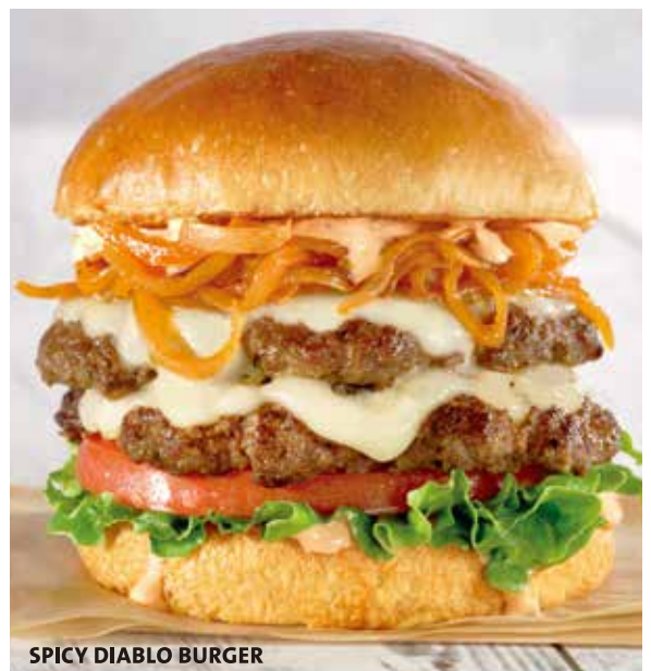
SPICY DIABLO BURGER

スマッシュバーガーパテ2枚、モンテレージャックチーズ、チポトレオニオン、トマト、リーフレタス、スパイシーマヨネーズ。