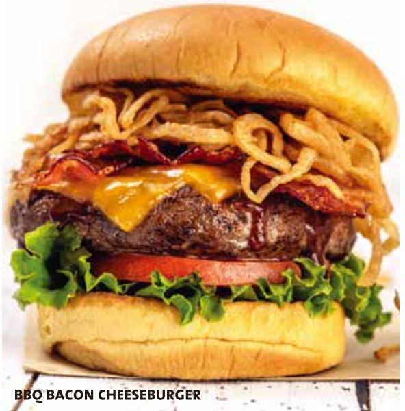
BBQ BACON CHEESEBURGER

A hand-made black bean, corn and quinoa veggie burger topped with grilled pineapple, barbeque sauce, Monterey Jack cheese, crispy shoestring onion, served on a toasted bun with a spicy slaw.† ブラックビーン、キヌア、コーンパテ、モンテレージャックチーズ、BBQパイナップル、コールスロー、フライドオニオン