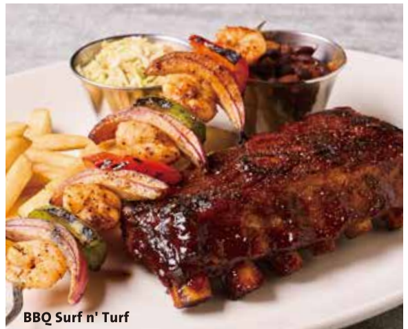
BBQ Surf n' Turf

BBQ RIBS & PULLED PORK BBQ リブ&ブルドポーク ¥4,380-