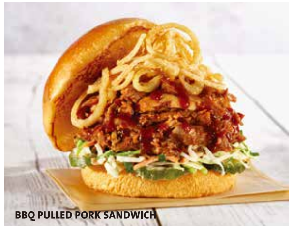
BBQ PULLED PORK SANDWICH

Hand-pulled smoked pork with our house-made barbecue sauce, served on a fresh toasted bun with coleslaw, pickles and shoestring onions. 細かく裂いたポークにBBQソースで味付けしたサンドイッチ。