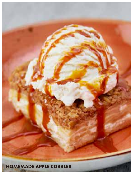
HOMEMADE APPLE COBBLER

ブラウニー、アップルコブラー、チーズケーキの三種類を一度に楽しめる贅沢で欲張りでロックな一皿です。